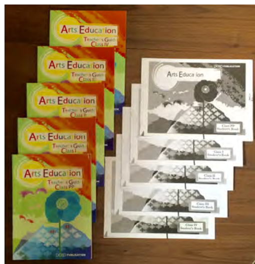
図1 ブータン王国の図工の教科書 (2016年、筆者撮影)

では、現在から未来にかけてはどうだろうか。身近な話題として、やはり気になるのは「学習評価」だろう。学習指導要領の改訂で育成すべき資質・能力が明確化されたのに伴い、評価すべき資質・能力も3つの観点に整理された。この整理はすべての教科・領域に共通していることから、教科横断が前提の融合的な学び、さらには教科再編までも予感させる。さらに芸術教育の文化庁移管が話題になった。これまで文部科学省が所管していた「学校における芸術に関する教育の基準の設定に関する事務」を、新たに文