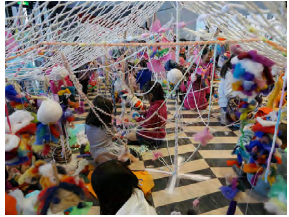
図4 筆者が学生と取り組んでいる『アートツール・キャラバン』(2017年、川崎)

二つ目は「美術のミカタをふやす」ことである。筆者は、これまで10か年にわたり、学生たちと様々な場所で親子向けの造形ワークショップを実践・展開してきた(図4)。その10年間のあいだに、ワークショップに子どもと一緒に参加しているおとな(保護者)の関わり方や意識の変化を感じている。以前は、子どもを預けて買い物に行ったり、子どもの活動を