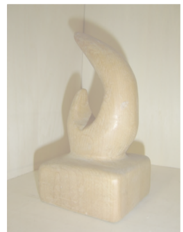
図5 子どもの表現の事実

三つ目は、「今こそ、個人内評価を」である。先述の通り、「感性や思いやり」は観点別評価の観点には含まれず、個人内評価で扱うことになっている。その重要性を、今一度美術教育から訴えたい。かつて中学校の美術教師であった筆者が、2年生に対して木彫の授業を行ったときのことである 10 。授業にほとんど参加しない学校一の暴れん坊がいたのだが、この木彫の授業だけは出席し、さらには既定の授業時数を超えてもなお、他の学級・学年の授業の時間や休み時間に美術室